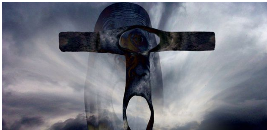
Zdzisław Beksiński, Fotomontaż komputerowy bez tytułu, 2000-05 r., fragment