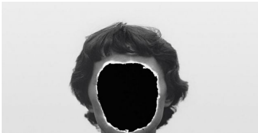
Zdzisław Beksiński, "Bez tytułu", fragment, (fot. Wydawnictwo BOSZ)